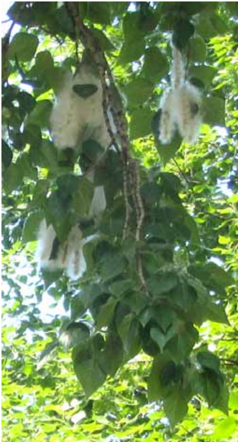
СЕРЁЖКИ, ОКУТАННЫЕ ПУХОМ.

Тополь цветёт мелкими цветками, собранными в соцветия, похожие на серёжки. На мужских деревьях серёжки бордовые, на женских – жёлто-зелёные. Пыльца разносится ветром. После опыления цветочки превращаются в зелёные коробочки, которые, созревая, чернеют. В коробочках находятся чёрные семена, к ним прикреплено множество белых волосков, которые, отрываясь вместе с семенем от серёжки, образуют «тополиный пух».