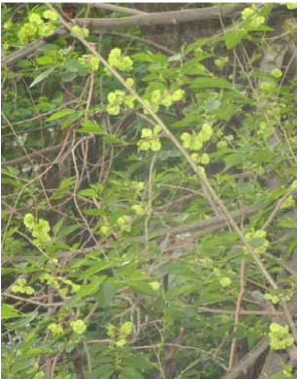
9 МАЯ. ПЛОДЫ ВЯЗА