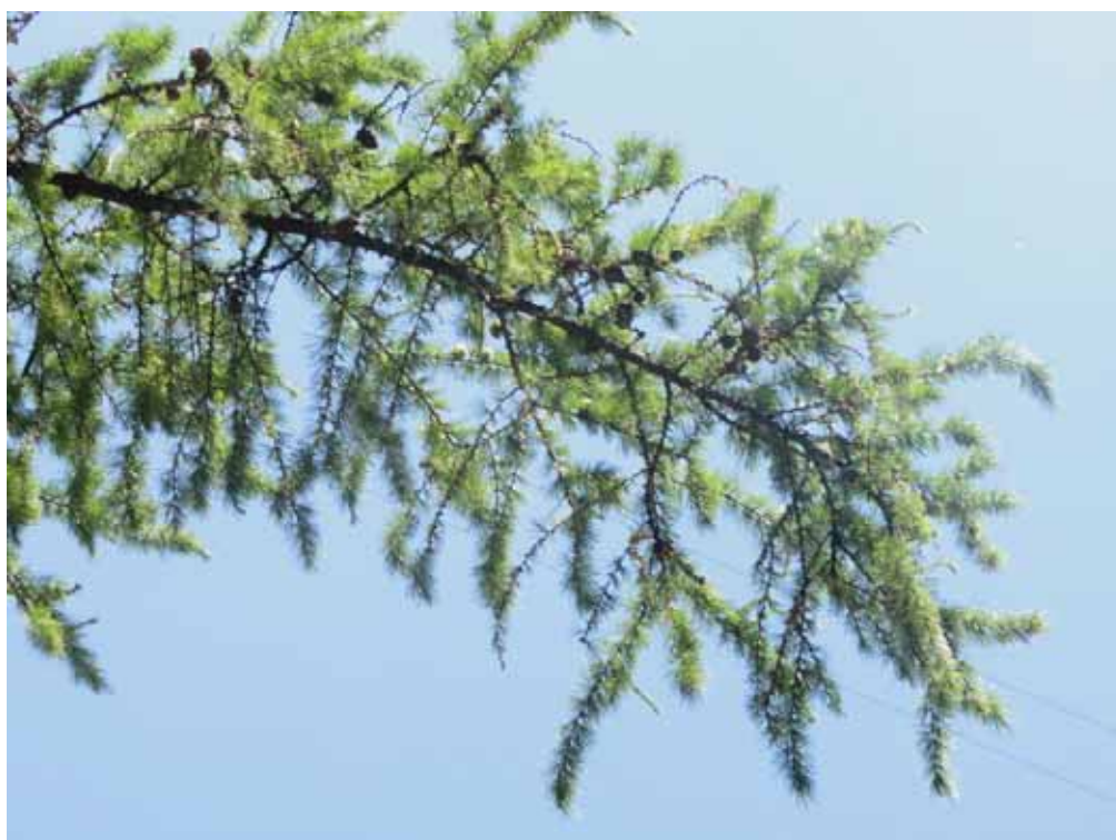
НА ЭТОЙ ВЕТКЕ И СТАРЫЕ, И МОЛОДЫЕ ШИШКИ