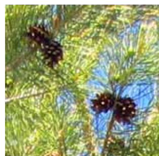
ГODOBАЛЫЕ И ЗРЕЛЫЕ – ДВУХЛЕТНИЕ