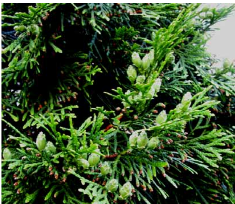
МОЛОДЫЕ ШИШКИ ТУИ