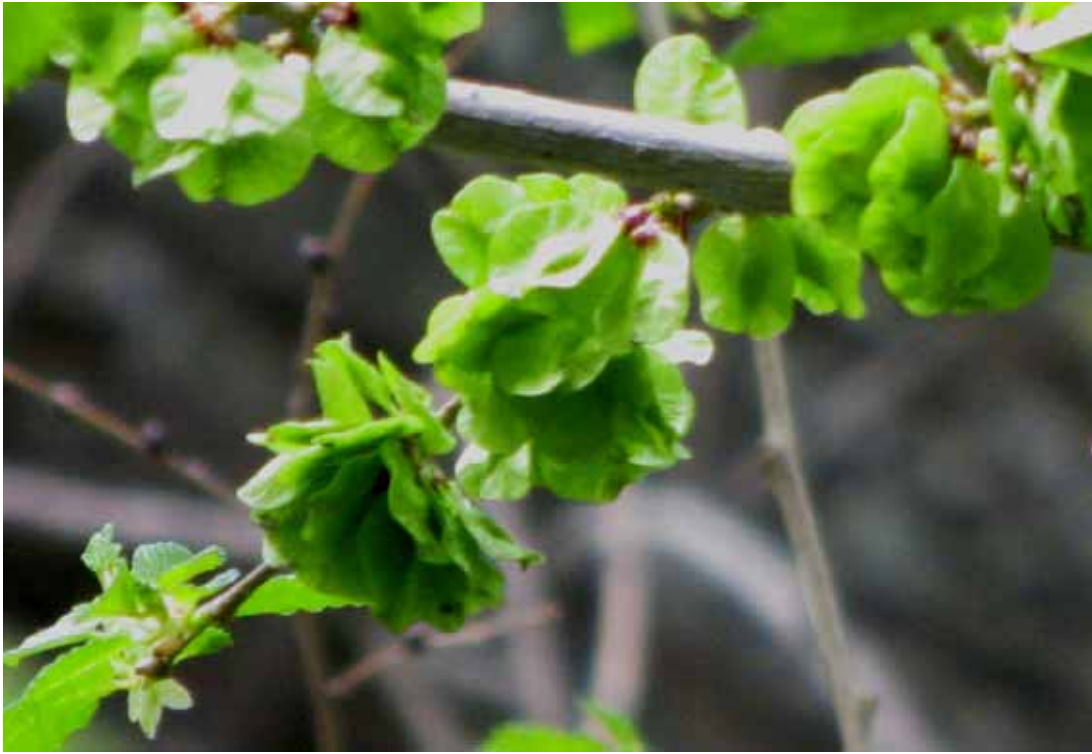
ЦВЕТЫ ВЯЗА. 6 МАЯ