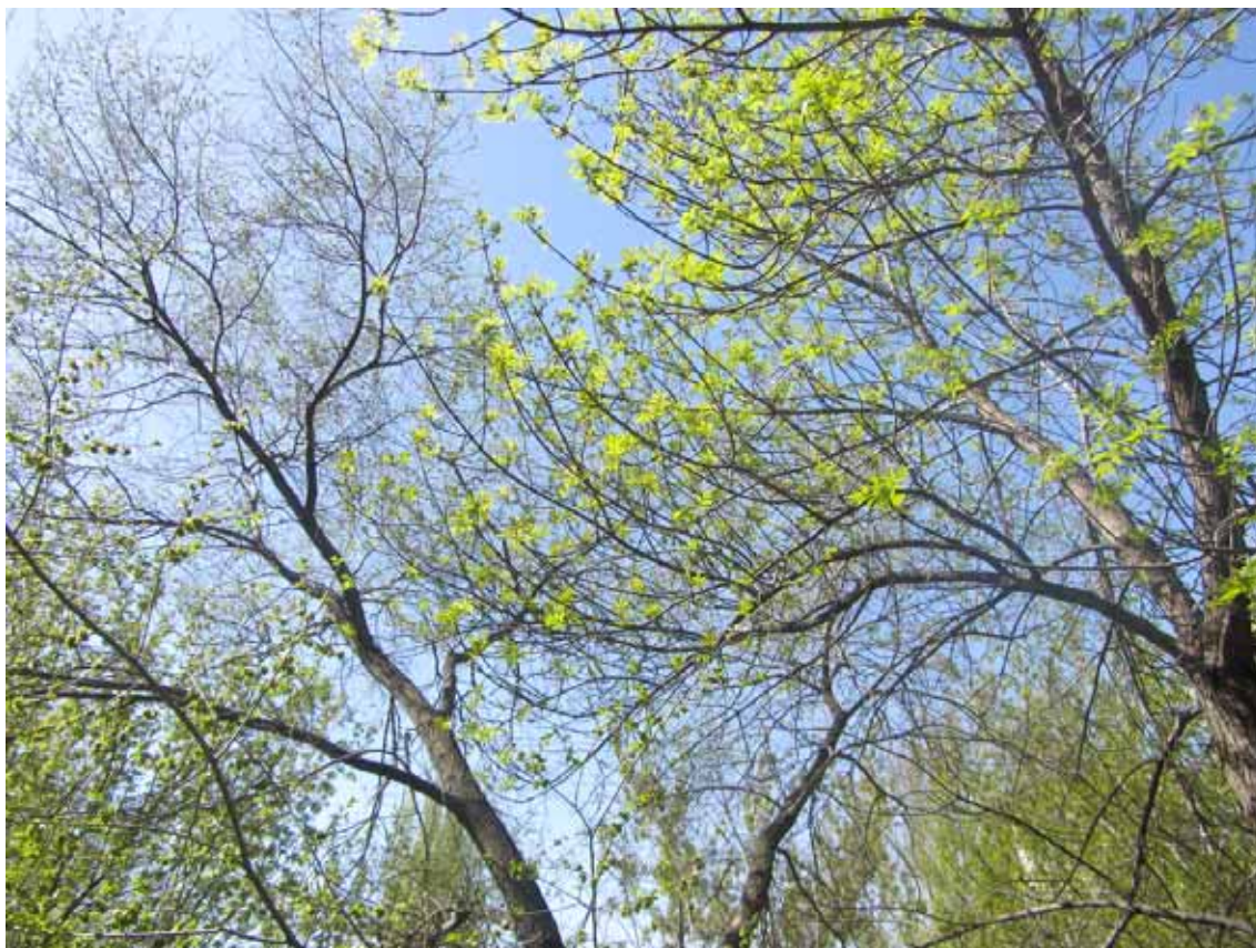
Слева вяз, справа – ясень

30 АПРЕЛЯ. У ясеня уже листочки, а у вяза вершина ещё не «оделась», только на нижних веточках «пуговики» цветков.