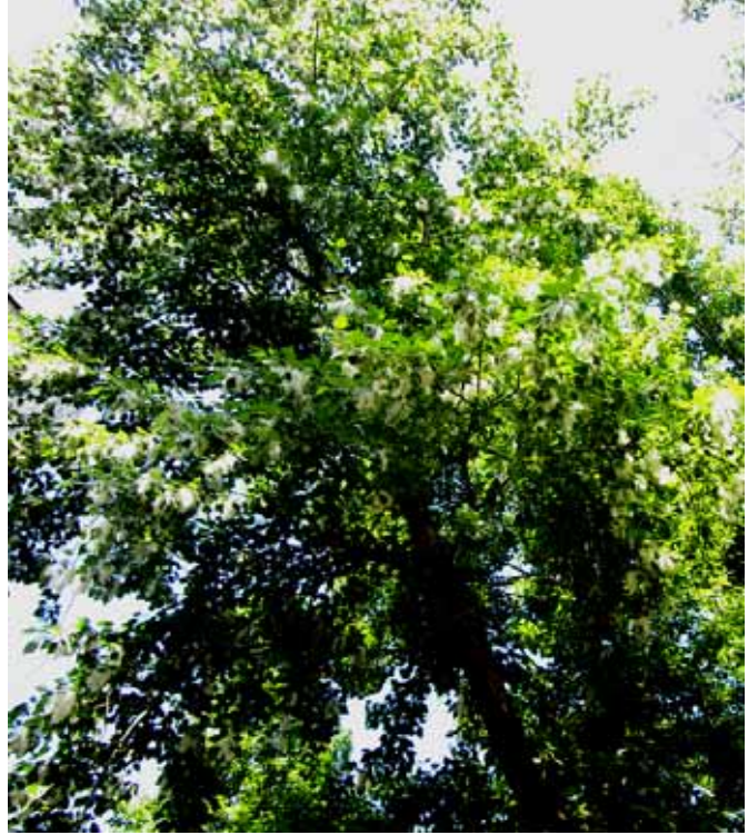
ТОПОЛЬ В ПУХУ (Женское дерево)