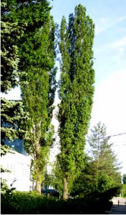
ДВА СТРОЙНЫХ ТОПОЛЯ