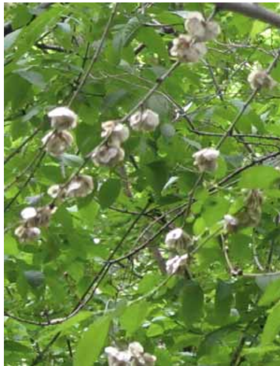
СОЗРЕВШИЕ ПЛОДЫ ВЯЗА. 14 МАЯ

Внутри созревшего плода, в центре, находится орешек – семя. Семена вяза разносятся ветром на большие расстояния.