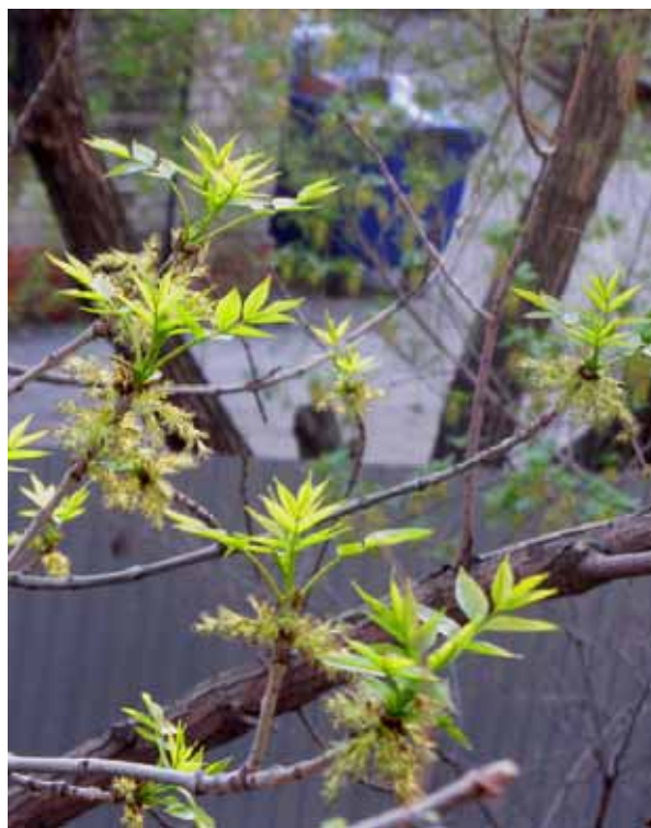
Соцветия и листья ясеня

«Серёжки» росли быстро, а через месяц превратились в плоды – крылатки. Плоды ясеня созревают в сентябре-октябре, но остаются на ветвях до ранней весны, спасая от голода зимующих птиц.