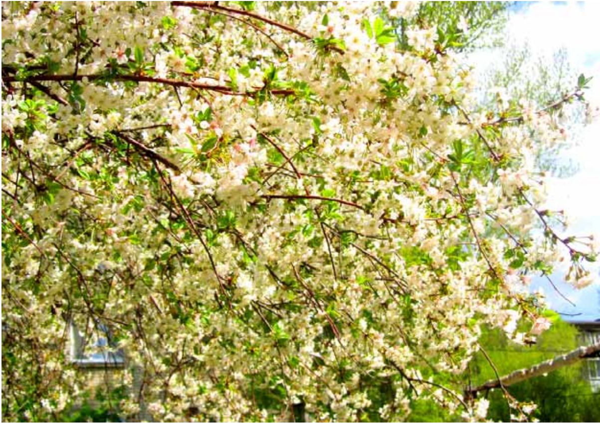
ВИШНЁВОЕ БУЙСТВО И ВИШНЁВЫЙ ЦВЕТ. 4 мая