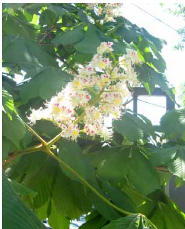
ЛИСТЬЯ И ЦВЕТЫ БЕЛОГО КАШТАНА