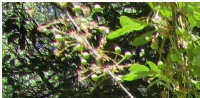
18 мая. ЯГОДКИ