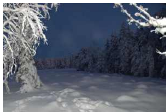
«Поет зима-аукает, мохнатый лес баюкает...» (С. Есенин)