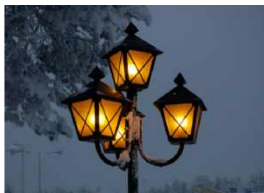
«Так явно сиявшие до самой зари – кого провожаете, мои фонари? Кого охраняете, кого одобряете, кого озаряете ?..» (М. Цветаева)