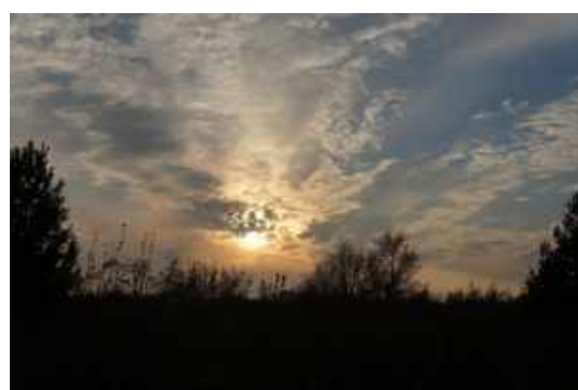
«Уж небо осенью дышало ... короче становился день...» (А. Пушкин)

Почему одно из моих увлечений-фото? Скорее всего потому, что позволяет запечатлеть моменты, учит видеть красоту в самых обычных вещах и делиться своими впечатлениями с другими людьми. Фото – это прекрасная возможность передать свои чувства, настроение и видение мира... В ноябре 2024 года, принимая участие в III Всероссийском творческом конкурсе-фестивале педагогических работников «Виват, таланты!», я выбрала работы, иллюстрирующие различные времена года и мир вокруг нас. А отразить свои мысли решила через строки из произведений великих классиков. Почему так? Хотела продемонстрировать любовь к природе нашей прекрасной родной земли, которая поистине необыкновенна и уникальна. Именно с ней мы знакомимся в первую очередь в детстве, именно ею восторгаются писатели и поэты, именно любовь мира вокруг помогает творить добро, сохранять морально-нравственные ценности и объединять народы.