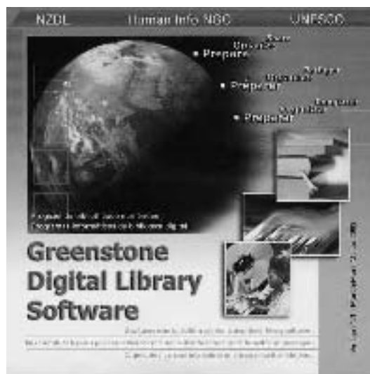
Фото на обложке. CD-ROM "Цифровая библиотека Гринстоуна"

Был также организован показ программного обеспечения "Цифровая библиотека Гринстоуна". Мощные поисковые средства и методы структурного доступа к этой программе позволяют создавать большие коллекции документов, которые за-