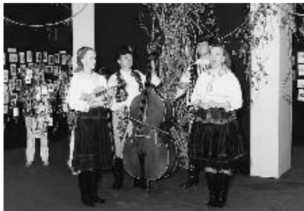
Конкурс "Ex-libris", Глоговец, сентябрь 2003 г. Открытие выставки – семейный ансамбль народной музыки Хеско

Таким образом, сотрудничество приносит весьма положительные результаты и в нем отмечаются некоторые яркие моменты, например, открытие в 1999 г. третьего конкурса "Ex-libris", в ходе которого было проведено две выставки в Глоговце и организована совместная словенско-словацкая программа торжественных мероприятий. Первая выставка была посвящена работам победителей конкурса "Ex-libris", а другая проводилась по теме "Юмор в сло-