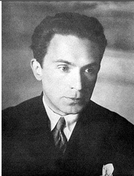
Александр Леонидович Чижевский (1897 — 1964)

...я допускаю, что некоторая часть такого рода явлений - не иллюзия, а действительное доказательство пребывания в космосе неизвестных разумных сил, каких-то существ, устроенных не так, как мы, по крайней мере из несравненно более разреженной материи.