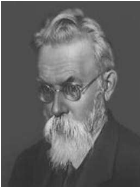
Владимир Иванович Вернадский (1863 - 1945)

Предлагаемая авторами мировоззренческая доктрина, учитывающая знания, полученные на этих направлениях, таким образом, представляет собой научное мировоззрение. Но что такое научное мировоззрение ? Вот как определял его выдающийся российский философ и ученый В.И.Вернадский: