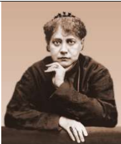
Елена Петровна Блаватская (1831- 1891)

Автотрофность — это еще и функция интеллекта, и космического разума, и спинорно-торсионных полей, и солитонголографических механизмов в каждой клетке нашего организма .