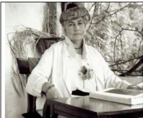
Елена Ивановна Рерих (1879-1955)

иррациональный ответ, который является единственным логическим выводом из физической философии, делающей из них реальные факты, единственную основу реального знания