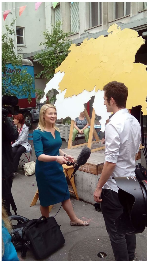
Reuters, Базель, Швейцария (2016)