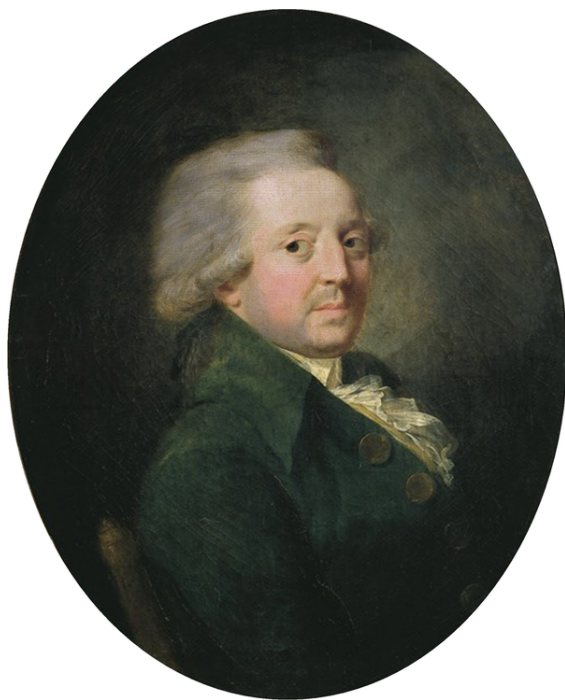
Маркиз де Кондорсе

жение, которое участвовало в выборах во многих странах. Наибольшую поддержку партия получила в Канаде (см. Партия социального кредита Британской Колумбии ). Идея о безусловном основном доходе была похоронена сторонниками кейнсианства, усилившими роль государства.