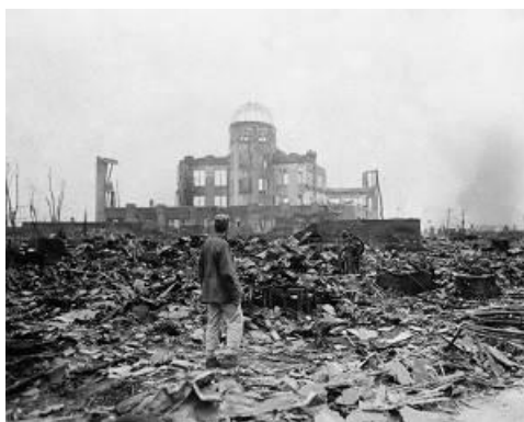
Hiroshima after the US atomic bombing

6 августа 1945 года и 9 августа 1945 года Соединенные Штаты сбросили атомные бомбы на города Хиросиму и Нагасаки, Япония. Заявленной причиной этого первого и до сих пор единственного применения атомного оружия была необходимость ускорить окончание Второй мировой войны.