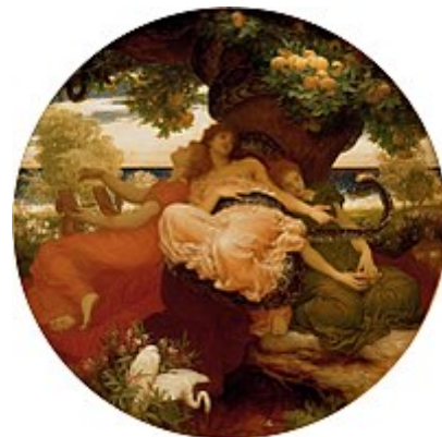
Ф. Лайтон. «Сад Гесперид»: змей Ладон охраняет яблоки

Wikipedia® — зарегистрированный товарный знак некоммерческой организации Wikimedia Foundation, Inc.