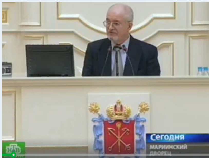
Депутат Ленсовета/Петросовета: 1990–1993: Первая в истории фракция «Сферной демократии». Первый «Семейный Кодекс России» и «Детский Фонд Достоевского» https://peacefromharmony.org/?cat=ru_c&key=282