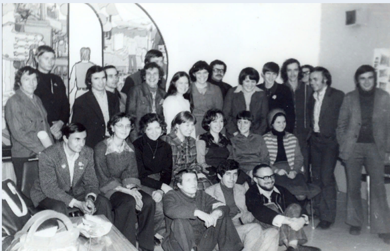
Студенческий клуб "Демиург" 1975

Больше фотографий и деталей смотреть здесь: