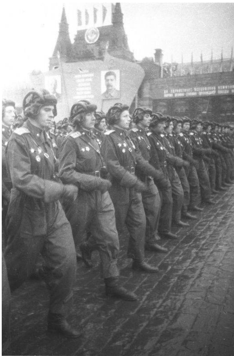
Парад Победы. Строй офицеров-танкистов