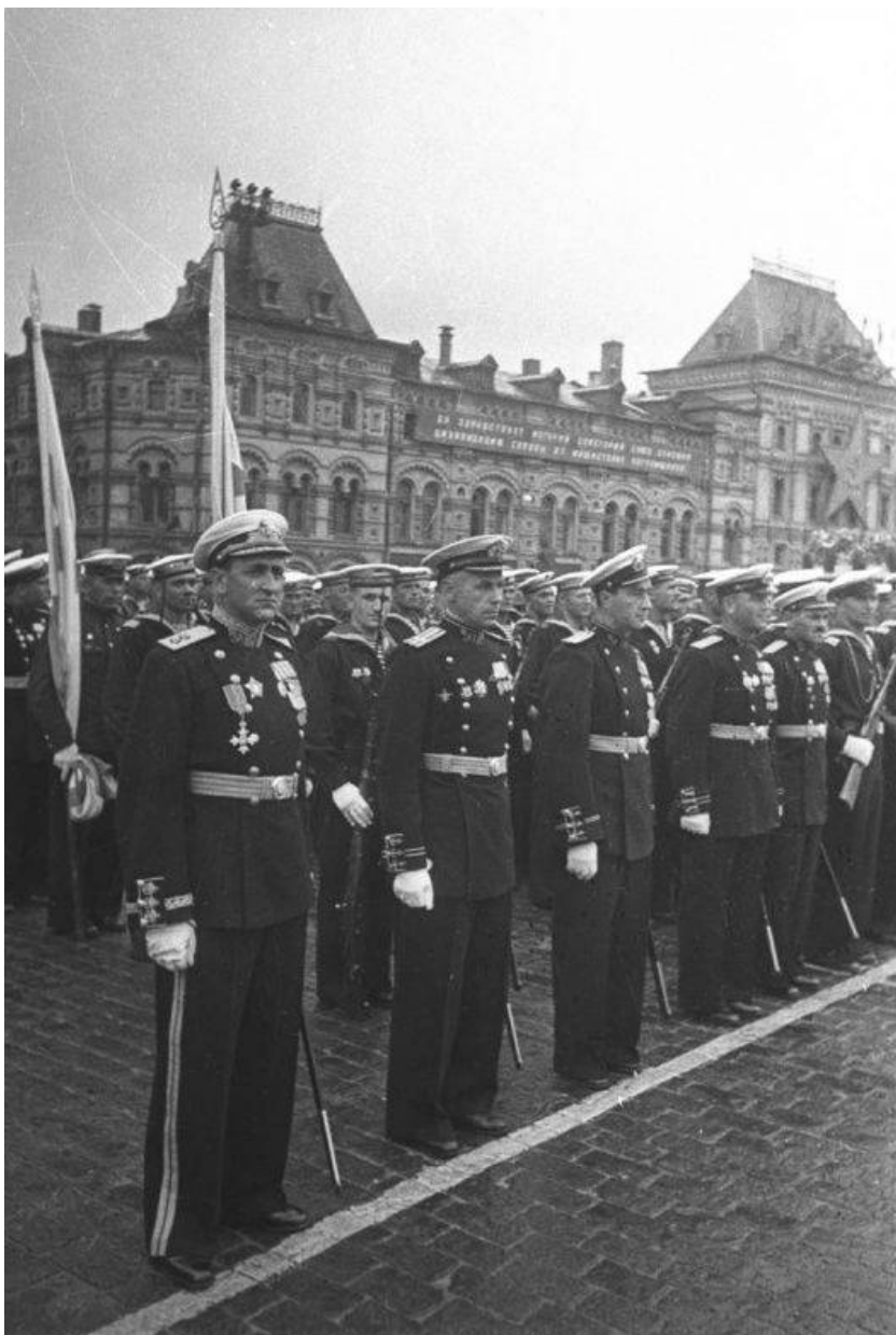
Парад Победы. Строй моряков