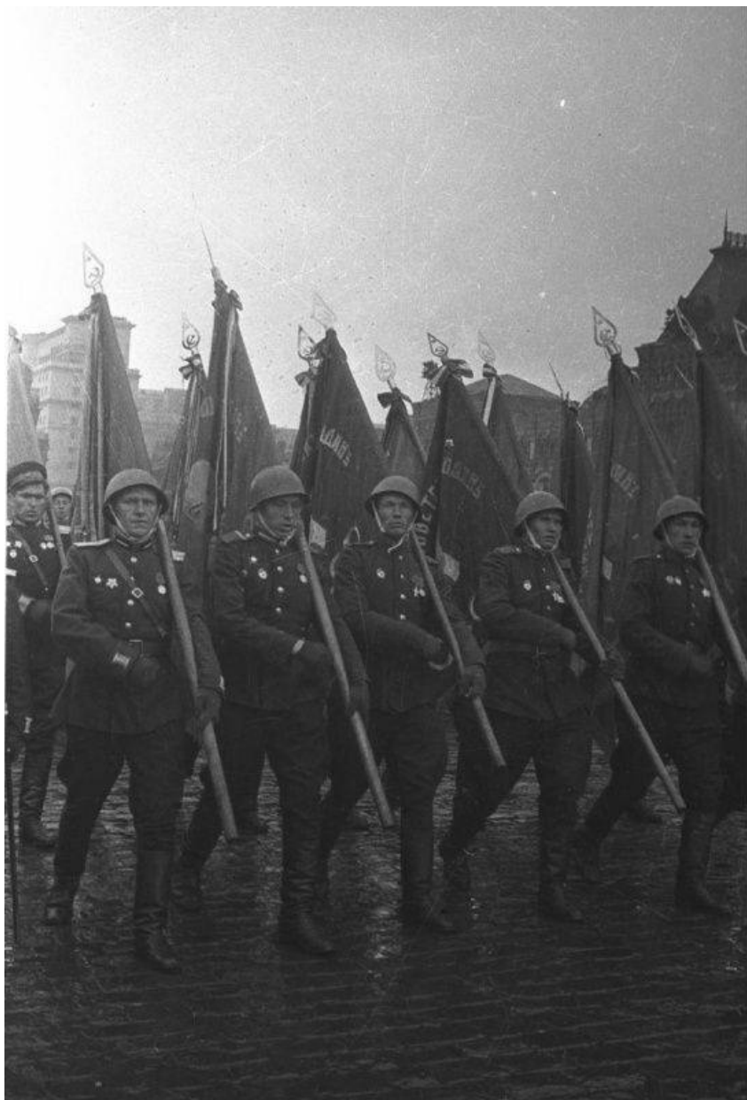
Парад Победы. Знаменосцы