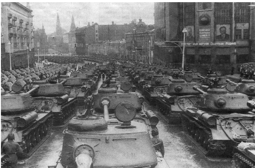
Танки ИС-2 перед вступлением на Красную площадь