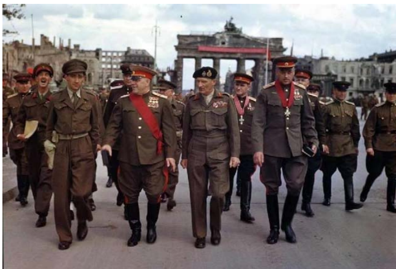
Фото с Парада Победы 7 сентября 1945 г. в Берлине