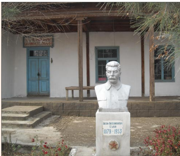
Бюст Сталина в чайхане имени Сталина. Канибадам, Таджикистан.