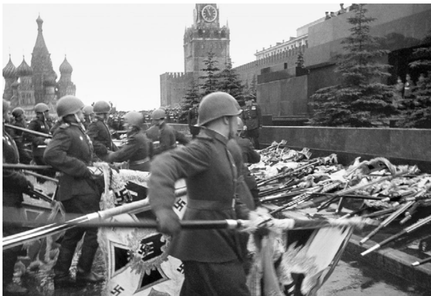
Поверженные штандарты гитлеровских войск

В праздничном мероприятии должны были участвовать десять сводных полков фронтов и сводный полк Военно-морского флота. К участию в параде также привлекались слушатели военных академий, курсанты военных училищ и войска Московского гарнизона, а также военная техника, включая самолеты. При этом в параде не приняли участие войска существовавшие по состоянию на 9 мая 1945 года ещё семи фронтов ВС СССР: Закавказский фронт, Дальневосточный фронт, Забайкальский фронт, Западный фронт ПВО, Центральный фронт ПВО, Юго-Западный фронт ПВО и Закавказский фронт ПВО.