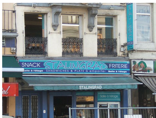
И кафе