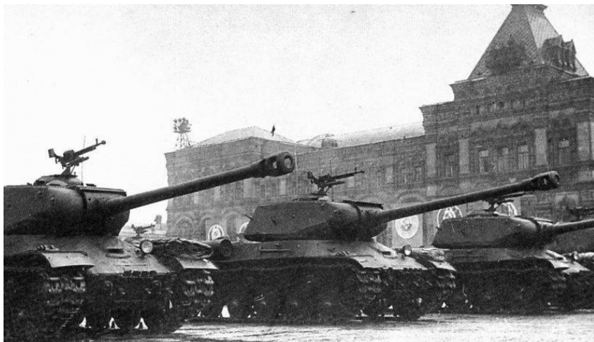
Тяжелые танки ИС-2 проходят по Красной площади во время парада в честь Победы 24 июня 1945 года