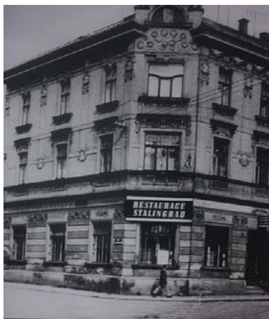
Фото: Екатерина СИМОХИНА

А в Ново-Паке в Чехословакии есть отель "Сталинград", Фото: Екатерина СИМОХИНА