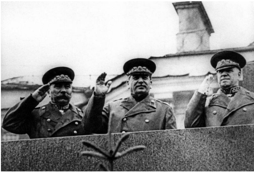
Легендарный и Священный Парад Победы 24 июня 1945 года // Препринт документальной киноплёнки 24 июня 1945 года. URL: https://topwar.ru/77498-svyaschennyu-parad-pobedy-24-iyunya-1945-goda-triumf-sovetskogo-naroda-pobeditelya.html