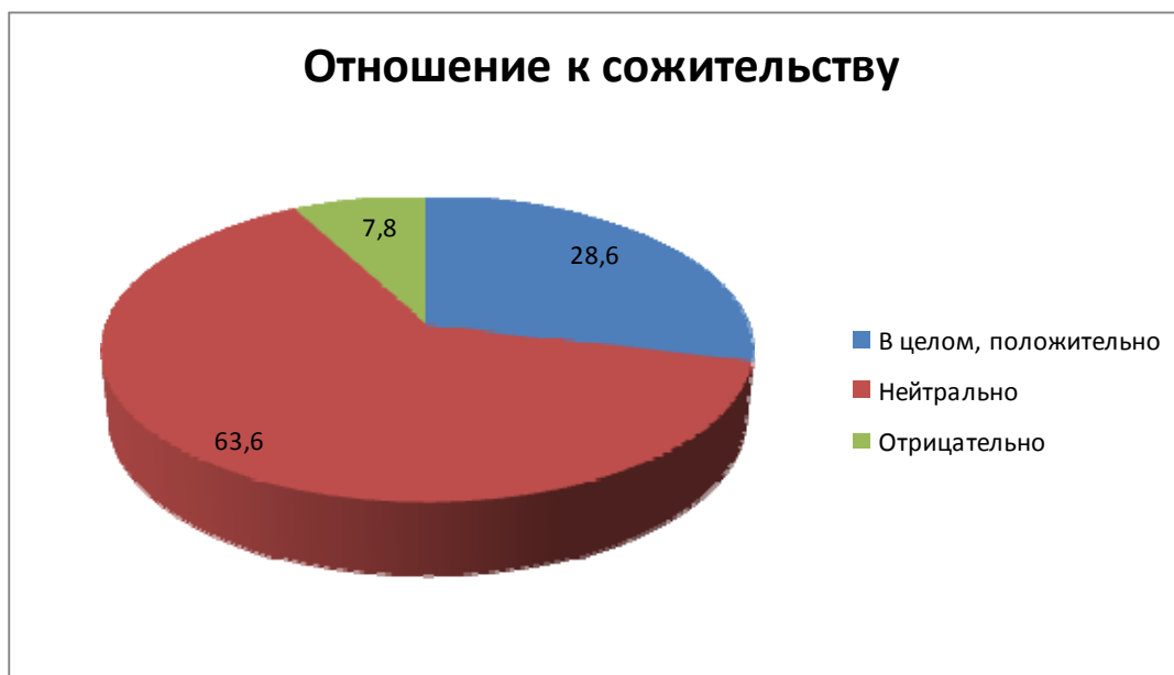
Рисунок 2. Отношение к незарегистрированному браку (сожительству) (% от общего числа опрошенных)

Большинство студентов определяют семью, как высший смысл и ценность жизни, такой вариант ответа выбрали 56,4% опрошенных. 30,7% не умаляют необходимость в их жизни семьи, но считают, что для счастливой полноценной жизни наличие семьи не является приоритетом. Эти данные свидетельствуют о том, что ценность семьи в системе жизненных ценностей молодежи занимает одно из ведущих мест, что, безусловно, является положительной тенденцией развития института брака и семьи.