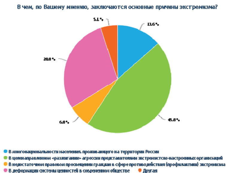
Рис.1 Основные причины экстремизма

межнационального диалога, также были молодые люди, которые затруднялись ответить на этот вопрос.