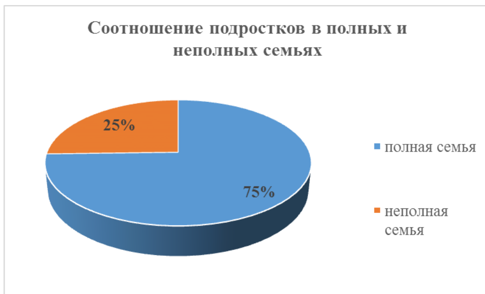
Диаграмма 1. Соотношение подростков в полных и неполных семьях (%) 44 опрошенных подростка (75%) имеют полную семью.