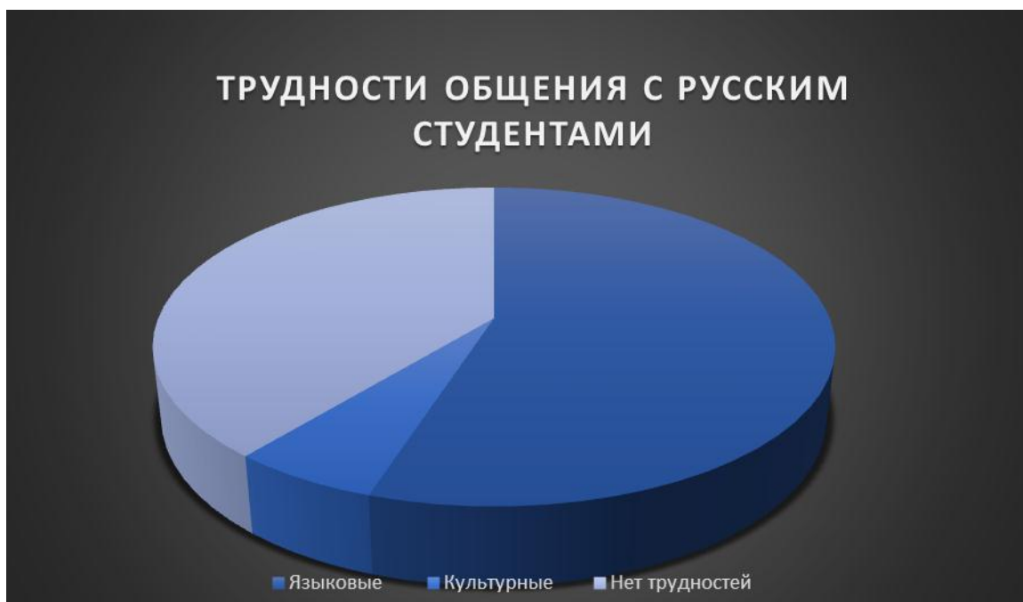
Рисунок 4 – Трудности общения с русскими студентами

человек) встретились с трудностями во время поиска работы, 54% студентов (17 человек) испытывали трудности связанные со знанием языка, 54% студентов (17 человек) испытывали трудности при общении с местным населением, 26% студентов (8 человек) испытывали трудности при получении медицинских услуг, 23% студентов (7 человек) испытывали сложности при адаптации к климату, 10% студентов (3 человека) испытывали проблемы с жильем (Рис. 3).