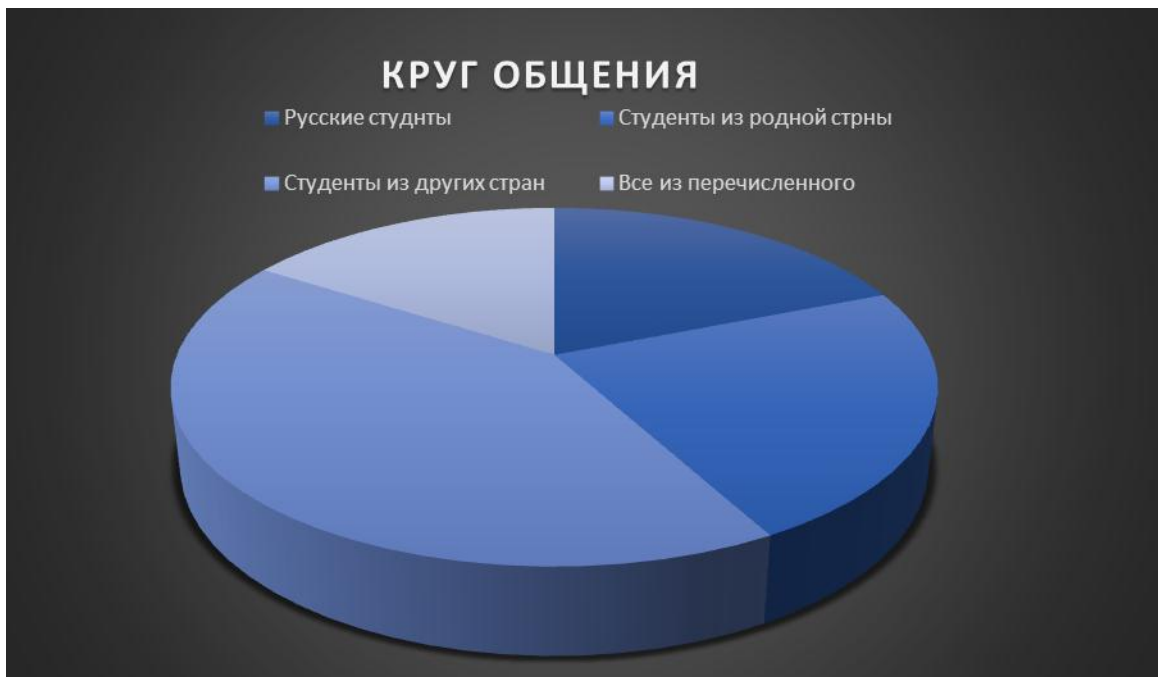
Рисунок 2 – Круг общения

Анализ результатов опроса иностранных студентов показал, что 42% студентов (13 человек) в основном общаются со студентами из разных стран, 23% студентов (7 человек) в основном с людьми из своей страны, 19% студентов (6 человек) в основном общаются с русскими студентами и 16% студентов (5 человек) со всеми студентами (Рис. 2).