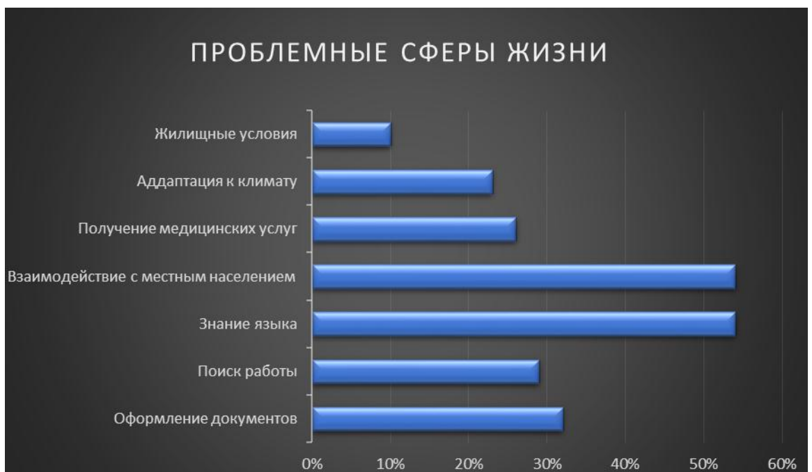
Рисунок 3 – Проблемные сферы жизни

Анализ результатов опроса иностранных студентов показал, что 42% студентов (13 человек) в основном общаются со студентами из разных стран, 23% студентов (7 человек) в основном с людьми из своей страны, 19% студентов (6 человек) в основном общаются с русскими студентами и 16% студентов (5 человек) со всеми студентами (Рис. 2).