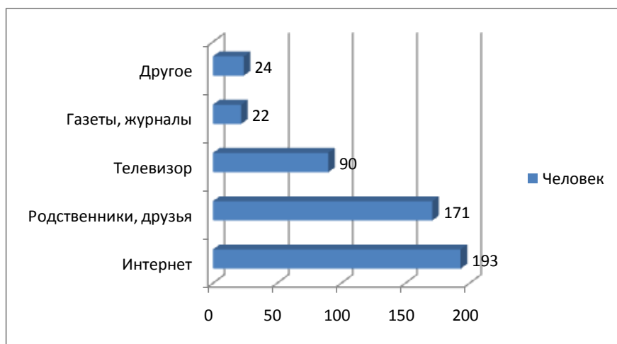
Диаграмма 3. Источники получения политической информации у молодежи

На вопрос – «По какой причине вы интересуетесь/не интересуетесь политикой» были даны самые разнообразные ответы, которые отражены в таблице 1.