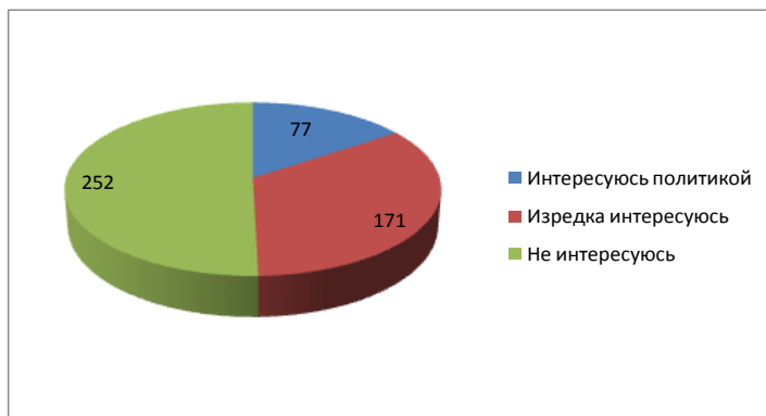
Диаграмма 1. Интерес молодежи к политике

На вопрос – «В каких политических мероприятиях вы принимали участие», были получены ответы, отраженные на Диаграмме 2.