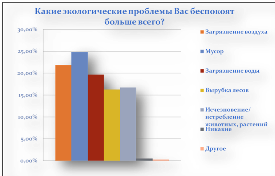
Рис.1- Экологические проблемы, беспокоящие молодежь г. Томска

Экологические проблемы, которые наиболее беспокоят молодежь г. Томска на данный момент заключаются в загрязнении воздуха, водоемов, и самой главной проблемой является мусор (недостаточное количество урн по городу, несанкционированные свалки, нет возможности сортировать мусор для дальнейшей переработки отходов).