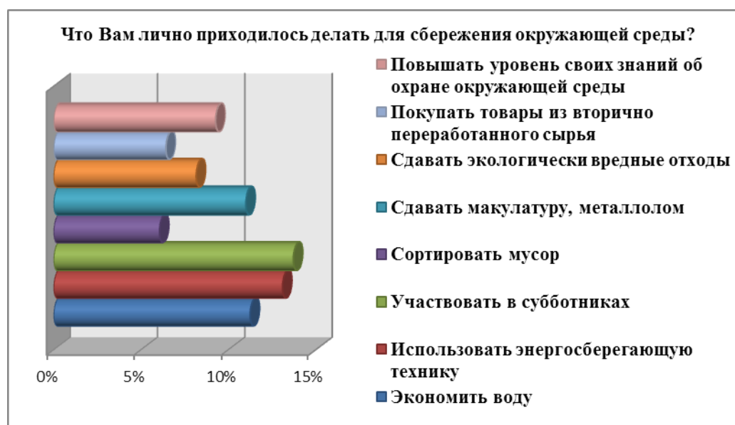
Рис.2 – Лично приходилось делать для сбережения окружающей среды

В данный момент молодежь выполняет такие действия по сбережению окружающей среды как, участвовать в субботниках 14% (111 человек); использовать энергосберегающую технику 13% (106 человек) сдавать макулатуру, металлолом в специализированные пункты приёма 11% (89 человек); экономить воду 11% (91 человек) повышать уровень своих знаний об охране окружающей среды 9% (75 человек); сдавать экологически вредные отходы (батарейки, лампочки, градусники) в специализированные пункты 8% (66 человек).