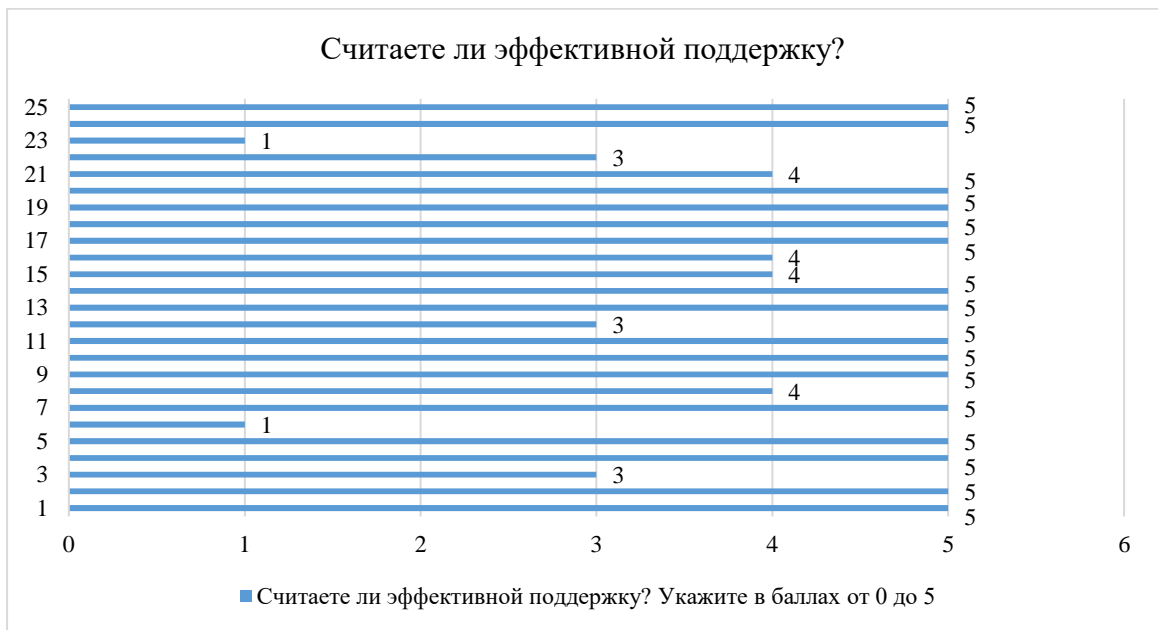
Рисунок 1. Результаты опроса студентов ТГУ

проведение опроса участников сообщества, результаты представлены в рисунок 1. В исследовании было опрошено 25 участников сообщества МПР.