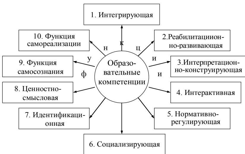
Рис. 2. Функции образовательных компетенций в развитии нетипичных детей

В общем виде нами выделяется десять таких функций, которые в схематическом виде отражены на рисунке 2.