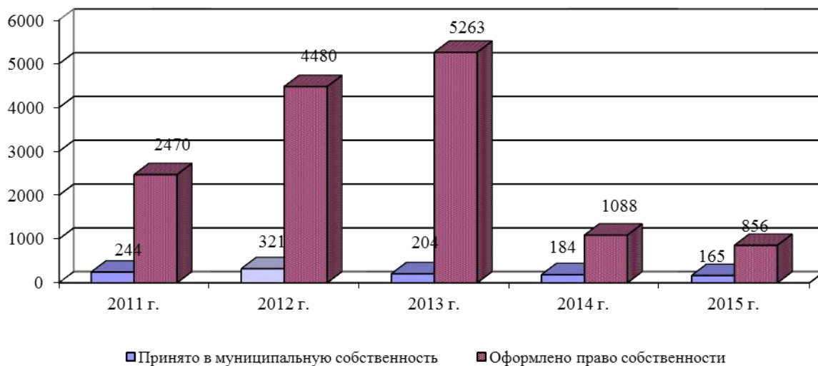
Рисунок 2 – Регистрация объектов муниципальной собственности КУМИ г. о. Саранск за 2011 – 2015 гг.

Согласно статьям 334 – 356 Гражданского кодекса РФ, ст. 14 Федерального закона от 06.10.2003 № 131-ФЗ «Об общих принципах организации местного самоуправления в Российской Федерации», Закона РФ от 29.05.1992 № 2872-1 «О залоге», Комитет по управлению муниципальным имуществом г. о. Саранск вправе передавать имущество, находящееся в управлении в залог.