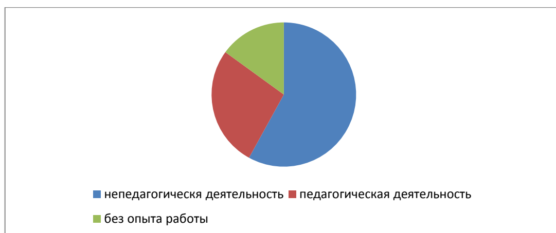
Рисунок 1. Наличие у студентов опыта работы (в %)

В результате контент-анализа ответов испытуемых на вопросы было установлено, что 85% уже имеют опыт трудовой деятельности и у трети из них эта деятельность была педагогической (рис.1)