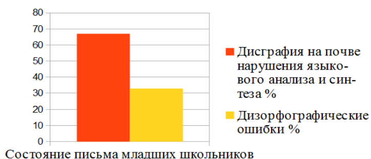
Рисунок 1 - Состояние письма у младших школьников с УО лёгкой степени