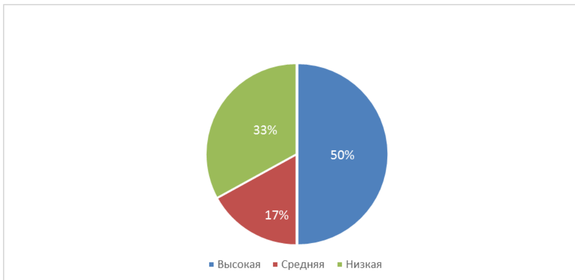
Рис.1. Результаты исследования общей самооценки младших школьников с нарушениями зрения

50% учащихся имеют завышенную самооценку, 17% адекватную и 33% низкую самооценку. Затем исследовался когнитивный компонент самооценки. Дети с завышенной самооценкой менее критичны к себе и своему состоянию, характеризуются личностной незрелостью, ограниченным кругом знаний о самих себе. Дети с адекватной самооценкой характеризуются личностной зрелостью, способны оценить свое состояние на данный момент. Дети с низкой самооценкой отличаются повышенной требовательностью к самим себе и неуверенностью в своих силах и возможностях. Исследование эмоционального компонента самооценки показало, что дети с завышенной самооценкой имеют дефицит знаний о нравственных категориях, слабое представление о собственных личностных качествах. Эти школьники менее критичны к особенностям своей личности. Дети с адекватной самооценкой имеют знания о нравственных категориях, четкое представление о положительных и отрицательных сторонах своей личности. Дети с низкой самооценкой имеют знания о нравственных категориях, но проявляют повышенную критичность к себе. Школьники фиксированы на недостатках собственной личности.