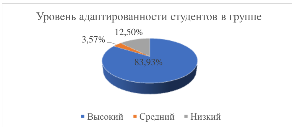
Рис.1. - Показатели адаптированности ингородских студентов-первокурсников в учебной группе

Подавляющее большинство опрошенных нами студентов оказалось с высоким уровнем адаптированности по обеим шкалам методики – к учебной группе и к учебной деятельности.