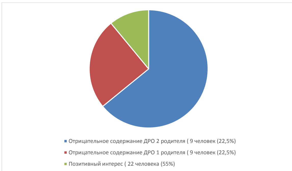
Рисунок 1 – Содержание детско-родительских отношений испытуемых

У большей части испытуемых преобладает позитивный интерес как содержание детско-родительских отношений. Это обуславливается отсутствием большого числа факторов внутренней (психологической) и внешней (социальной) природы, приводящих к возникновению дезадаптации, к появлению отрицательного содержания детско-родительских отношений.