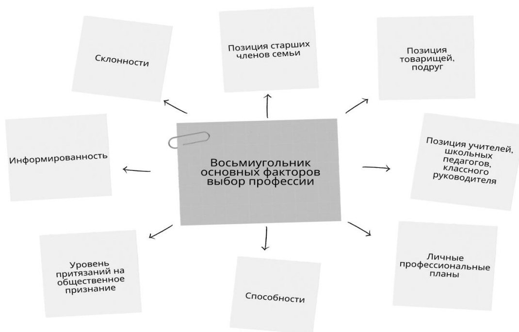
РИСУНОК 1.ВОСЬМИУГОЛЬНИК ОСНОВНЫХ ФАКТОРОВ ВЫБОР ПРОФЕССИИ

Как отдельный фактор следует отметить мотивацию достижения успеха. Для того чтобы осуществлять деятельность, необходимо иметь определенную мотивацию. Но чрезмерный уровень мотивации может вызвать негативные эмоции, что приведет к ухудшению или прекращению деятельности. Поэтому, как правило, высокая мотивация не всегда является лучшим вариантом для достижения поставленной цели [9]. Мотивация достижения определяет продуктивность человека, и удовлетворенность трудом. Также она способствует повышению уровня активности учеников, что обуславливает высокие учебные достижения учащихся [2].