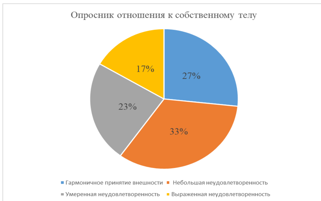
РИСУНОК 1 – РЕЗУЛЬТАТЫ ООСТ (%)

В начале исследования с помощью опросника ООСТ О.А. Скугаревского была изучена общая степень удовлетворенности собственной внешностью у девушек-моделей. Уровень неудовлетворенности внешностью варьируется от нормального до выраженного, при этом 73% опрошенных в той или иной мере недовольны своей внешностью (см. рисунок 1). Возможно, модельная среда с жесткой конкуренцией и строгими стандартами является фактором риска для формирования негативного образа тела, в связи с чем выявлен высокий процент неудовлетворенности своим телом.