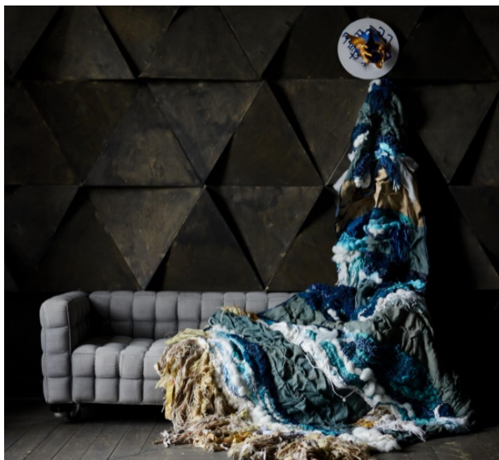
Рис. 7. Елена Юнькова. Море в стакане, 2021 [5]

Материал и техника: вторичное сырье (старая одежда, скатерти, постельное белье), мешковина, вискоза, шелк, шерсть, акрил; ручное ткачество [5].