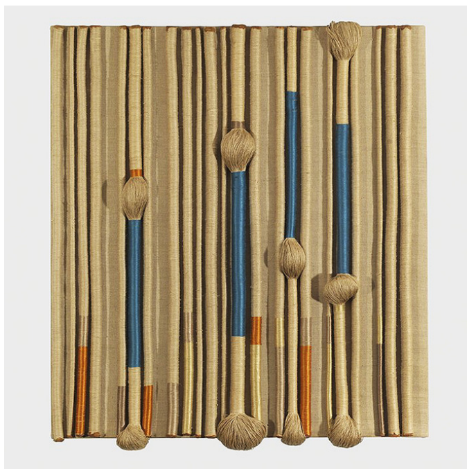
Рис. 1. Шейла Хикс. Панно для Architectural Commission, 1969. Лён, шёлк, хлопок. 84x75 см. Demisch Danant Gallery [2]

Шейла Хикс (Sheila Hicks, р. 24 июля 1934), американская художница, использовала в своих панно нетрадиционные элементы: прозрачную пластиковую лапшу, кусочки сланца, раковины моллюсков, воротнички от мужских рубашек, полоски резины, шнурки, детские майки, синие блузы медсестер и так далее [2] (Рис. 1, 2).