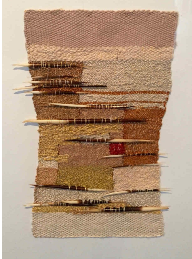
Рис. 2. Шейла Хикс. Панно. Лен, иглы дикообраза [2]

Долгое время художница путешествовала по миру и исследовала народные приёмы ткачества. Эти исследования не только оказали влияние на цветовое решение её работ, но и повлияли на появление новых, нетрадиционных, материалов в полотне. Творчество Шейлы Хикс направлено на привлечение внимания к утерянным техникам ткачества доколумбовой Америки.