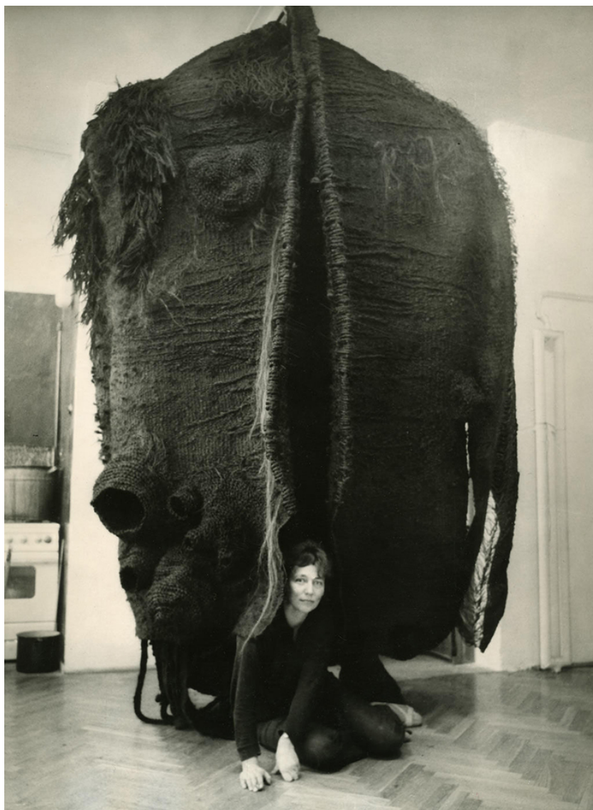
Рис. 3. Чёрные одежды, 1969 плетение, сизаль на металлической опоре, 300 x 180 x 60 см [7]