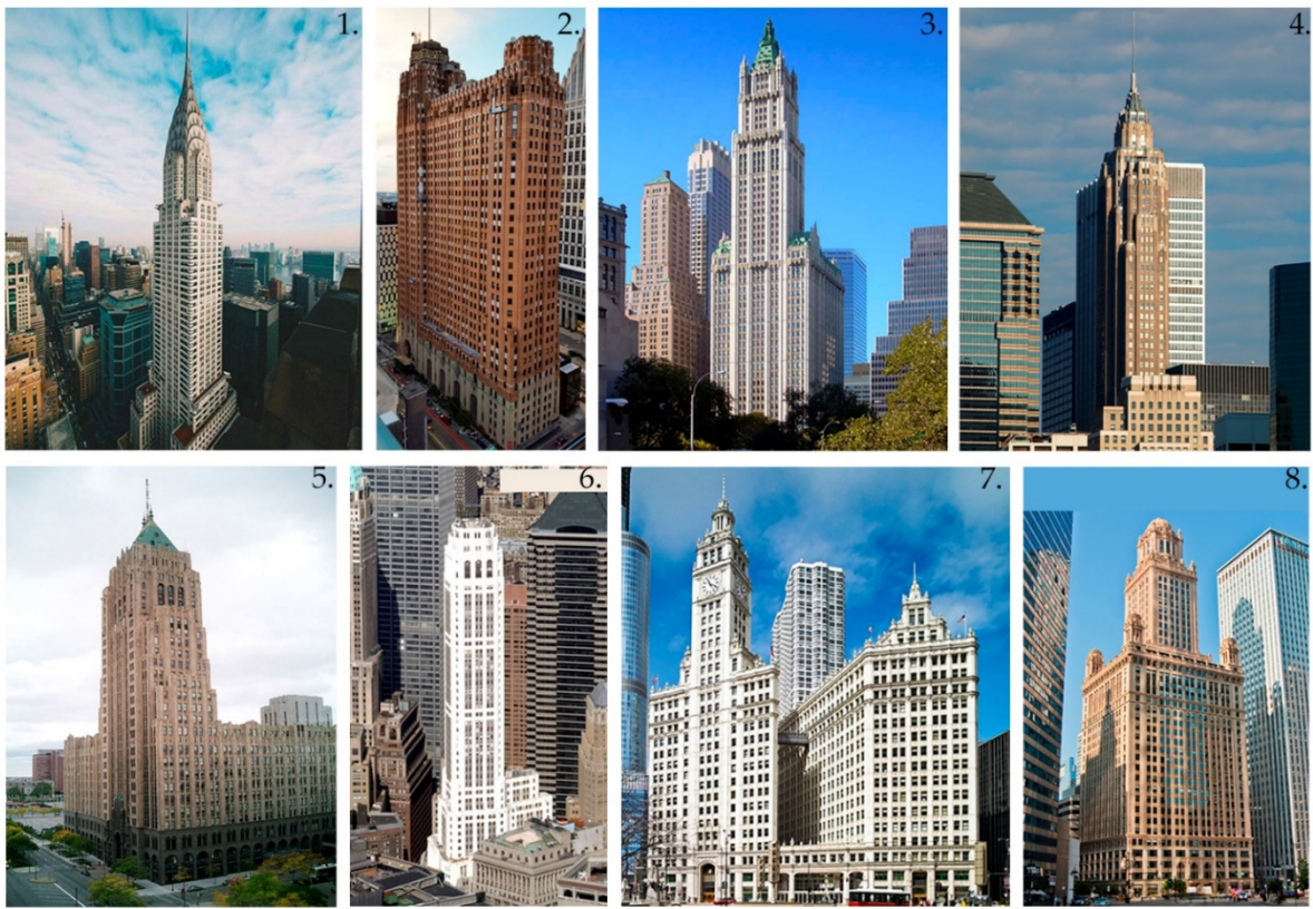
Рис. 5. Американские небоскребы в стиле ар-деко: 1) Крайслер билдинг, Нью-Йорк, 1930 г., арх. Уильям Ван Аллен; 2) Гардиан билдинг, Детройт, 1929 г., арх. Вирт К. Роулэнд; 3) Вулворт билдинг, Нью-Йорк, 1913 г., арх. К. Гилберт; 4) Американ Интернешнл билдинг, Нью-Йорк, 1932 г., арх. фирма Клинтон и Рассел; 5) Фишер билдинг, Детройт, 1928 г., арх. А. Кан; 6) Эксчейндж плэйс,20, Нью-Йорк, 1931 г., арх. фирма Кросс и Кросс; 7) Здание Чикагской биржи, Чикаго, 1930 г., арх. Холаберд и Рут; 8) Ювелирный дом на ул. Ист вакер, 35, Чикаго, 1927 г., арх. И. Дж. Гиавер, Ф. П. Динкельберг.

Исходя из этого, для гармоничного взаимодействия клубного дома «Эверест» с существующей застройкой авторами, очевидно, было выбрано фасадное решение светлых тонов без активной детализовки.