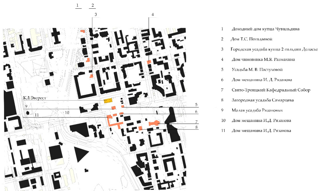
Рис. 4. Схема расположения исторической застройки в границах улиц 8 марта – Малышева – Белинского – Куйбышева.

В анализе высотных объектов других городов были упомянуты стиль и некоторые особенности пластических и цветовых решений, которые, казалось бы, должны отходить на второй план, когда речь идет о самой заметной особенности здания – высоте. Но в случае с ЖК «Эверест» эти аспекты имеют значение. И вот почему.