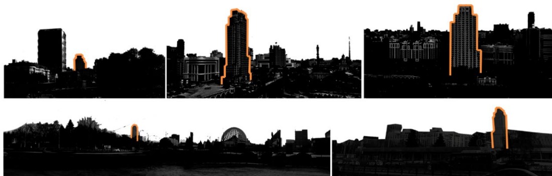
Рис. 3. Силуэт ЖК «Эверест» в формировании панорамы исторического центра Екатеринбурга

Важно отметить, что на восприятие объекта в панораме улиц также повлияла утрата телебашни за цирком. Этот объект, будучи в свое время самым высоким сооружением города (фактическая высота 239,7 м), вертикально фиксировал градостроительную ось реки Исеть и являлся сильным композиционным центром панорамы, воспринимаемой с городской плотины – сердца исторической территории Екатеринбурга. Теперь вместо телебашни именно «Эверест» становится таким центром в панораме, раскрывающейся с улицы Малышева, ведь он является теперь самым высоким объектом в границах улиц 8 марта – Малышева – Белинского – Куйбышева (Рис. 3).