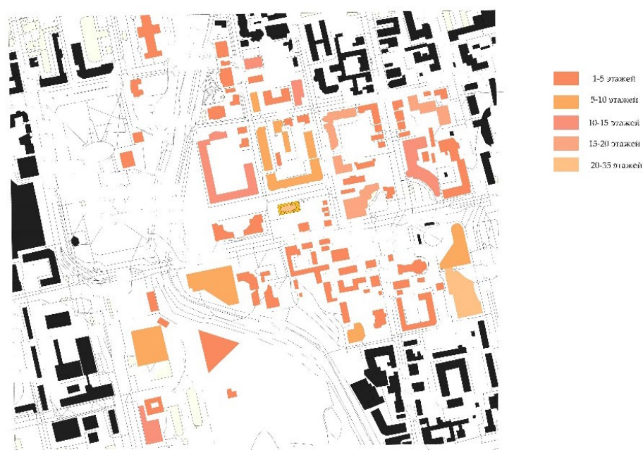
Рис. 1. Анализ Застройка в границах улиц 8 марта – Малышева – Белинского – Куйбышева

и ЖК «Дипломат» (19 эт.). Анализ высотной композиции изучаемого участка позволяет заключить, что по этажности современные здания гармонично взаимодействуют, но довлеют над историческими (Рис. 1).