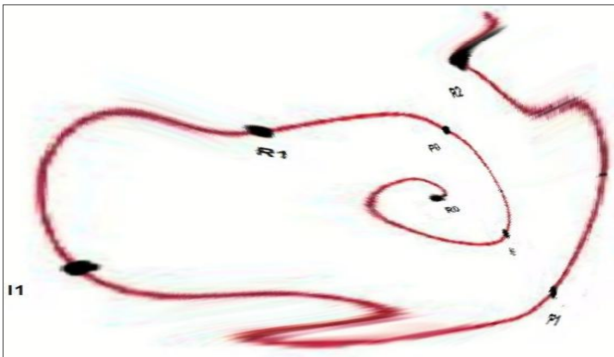
Рис. 4. Схема возмущающих воздействий кризисного типа в циклах генерации хозяйственной деятельности предприятий

Тем не менее, если анализировать генерацию хозяйственной деятельности предприятий за длительный период, то спиралевидный характер этого процесса будет очевиден. Однако будут заметны и неизбежные отклонения, вызванные влиянием экономических циклов, политическими и макроэкономическими возмущениями и иными внешними воздействиями.