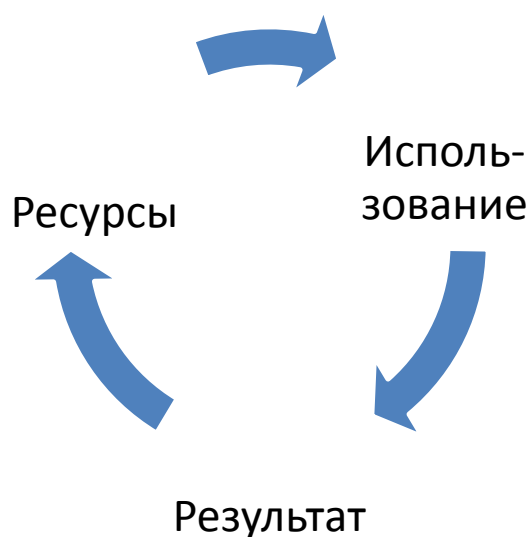
Рис. 1. Принципиальная схема генерации хозяйственной деятельности предприятий

Зарождение предприятия прямо связано с ресурсами производства, а в процессе их использования происходит генерация хозяйственной деятельности по схеме: ресурсы – использование ресурсов – результат. Но это лишь один цикл. За ним следует второй и последующие, поскольку этот процесс генерации непрерывен (рис. 1).