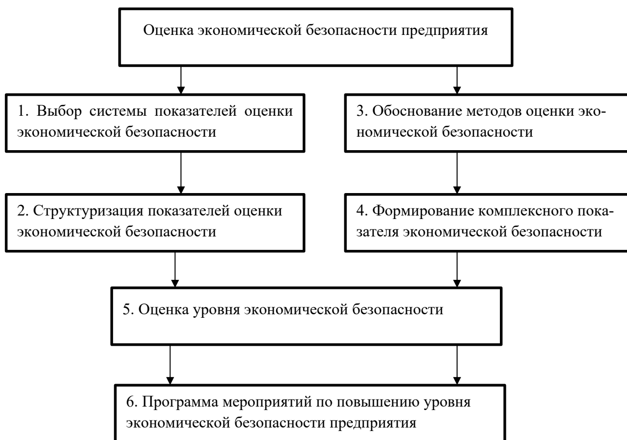
Рисунок 2 – Общая схема оценки уровня экономической безопасности коммерческой деятельности [8, с. 63].

Алгоритм комплексной оценки уровня экономической безопасности организации за конкретный отрезок времени представлен на рисунке 1.