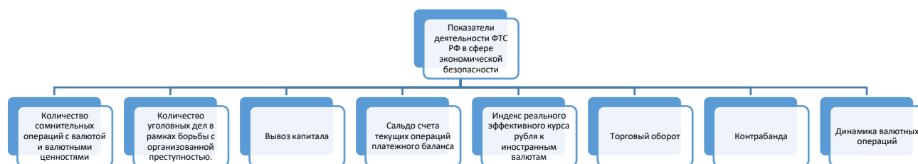
Рисунок 1 - Показатели работы Федеральной таможенной службы в части общеэкономической устойчивости страны. 1

Признаки или нормативы, которые бы определяли уровень работы Федеральной таможенной службы РФ в части экономической безопасности, на данный момент отсутствуют. Но, тем не менее, мы провели исследование этого вопроса, опираясь на издания и разработки с 2015 по 2020 год, и сделали вывод, что нормативами и итогами деятельности ФТС РФ в части экономической безопасности можно выделить следующие (рисунок 1).