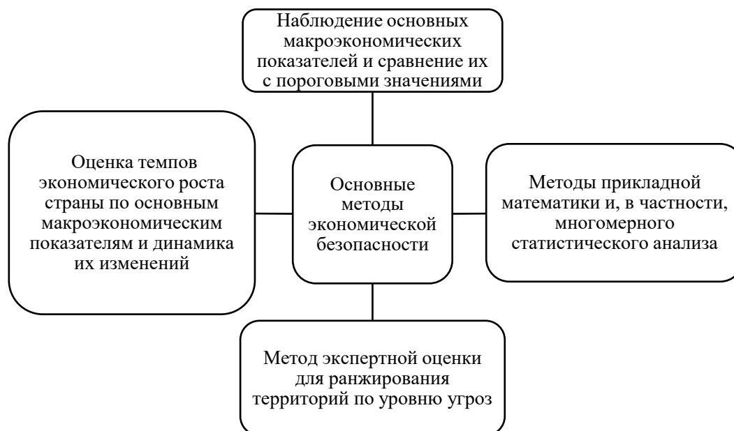
Рисунок 2 - Методы оценки экономической безопасности страны [5, с.118]

В обобщенном виде применяемые методы оценки экономической безопасности возможно представить в виде 4 групп (рис. 2)