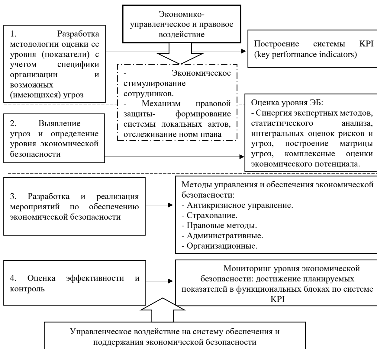
Рисунок 3 - Механизм экономико-правового обеспечения экономической безопасности [2, 3]

процессов. Так, Матвеев В. В., как представитель второго подхода к категории «экономическая «безопасность» представляет ее как формирование состояния организации при котором отмечается ее финансовое благополучие, стабильность бизнес-процессов, достижение ключевых видов деятельности, совершенствующие и развитие [6].