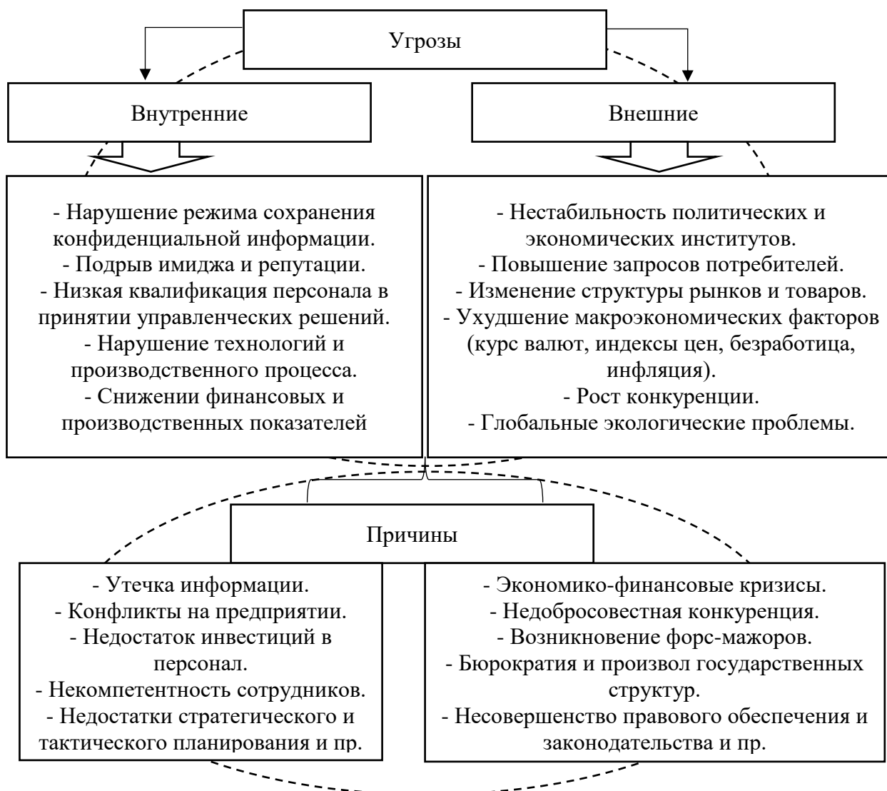
Рисунок 2 - Угрозы и причины экономической безопасности организации [4]

В основе первого подхода к сущности термина «экономическая безопасность» лежит понятийный аппарат «угроза» и факторы защищенности от ее возникновения. Так, Трофимова Т. В. и Ломовцева А.В. под экономической безопасностью организации понимают такое положение, при котором результативно применяется весь потенциал для целей защиты от негативного воздействия эндогенных и экзогенных угроз, дестабилизирующих экономику организации факторов. Сутью обеспечения экономической безопасности является стабильный результат достижения установленных целей [5].