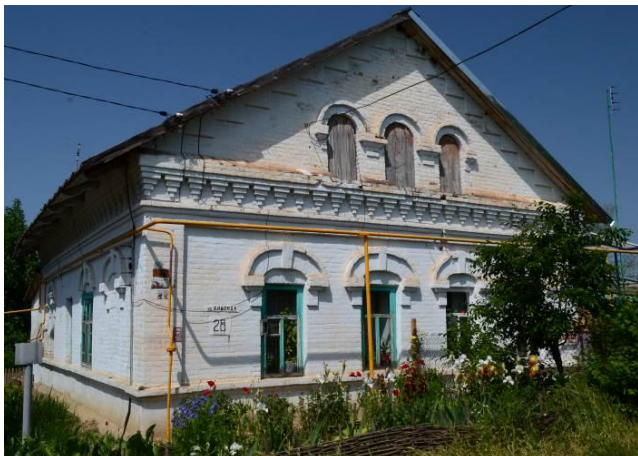
Летние палаты в усадьбе «Венцы». 2015

палаты)), перпендикулярно к ним, на противоположной стороне, – строение, на музейном плане обозначенное как баня с прачечной (?). Все эти здания, имеющие разный объем, выстроены в «русском стиле». Они имеют ряд общих черт в оформлении фасадов, имитирующих в камне элементы древнерусской архитектуры.