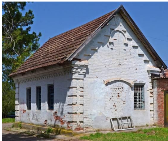
Летняя кухня в усадьбе «Венцы». 2015

Здесь можно выделить несколько тем с вариациями. Первое, что обращает на себя внимание – высокие двускатные крыши с фронтонами или щипцами (на здании кухни). Второе – прямоугольные оконные проемы с лучковым или слегка изломанным завершением вверху, в обрамлении кирпичных наличников (контрналичников) – «кокошников» с замковыми камнями. Окна расположены на двух боковых и заднем фасадах, причем по четыре с каждой стороны. Передний, или главный фасад «обезображен» позднейшими пристройками. Такие же по форме окна, но меньших размеров, расположены над карнизом из горизонтальных тяг и «городков», снизу ограничивающих треугольный фронтон. Это своеобразная метонимия красной, или лобовой доски в деревянной избе – «денце», как и три чердачных «красных» окна (центральное больше боковых) с «кокошниками», но без замковых камней. Здесь возникает двойная аллюзия – «светёлка» в русской бревенчатой избе и итальянское трехчастное окно в каменной архитектуре русского классицизма. Вдоль скатов фронтона выложена широкая полоса зубчатого декора, напоминающая орнамент