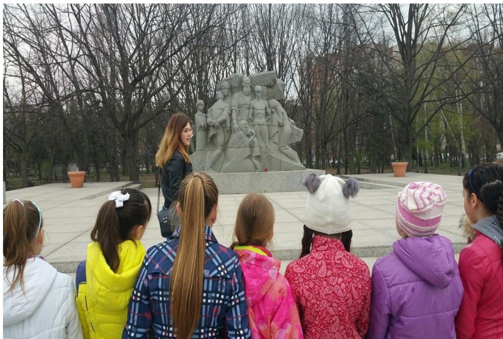
Рисунок 1 – Демонстрация скульптурной композиции памятника «Тринадцать тысячам краснодарцев – жертвам фашистского террора» и экскурсионный рассказ о тяжелых днях оккупации г. Краснодара

краснодарских школ узнают о страшных событиях тех лет – арестах мирных жителей, расстрелах, о страшном предназначении мобильных газовых камер – «душегубок». Ведь именно в Краснодаре с августа 1942 года впервые начали испытывать длинные семитонные серые машины с дизельным двигателем для удушения людей. Одновременно в «газваген» сажали до 80 человек. Не понимая, что происходит, думая, что они едут в баню, запертые в машине люди задыхались. Машины смерти проделывали длинный путь от гестапо, расположенного на улице Седина, до противотанкового рва за Чистяковской рощей. Первыми жертвами «душегубок» по архивным источникам стали пациенты психиатрической больницы города. За весь период оккупации Краснодара в одних только машинах смерти погибли 7000 человек – женщины, дети, старики. А всего фашистами были зверски замучены 13 000 краснодарцев. В их честь в год тридцатилетия Победы в Чистяковской роще, рядом с братской могилой (рис. 1), был открыт мемориальный комплекс жертвам фашистского террора [4].