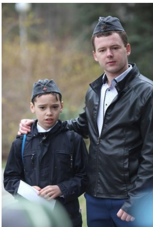
Рисунок 2 – Чтение фронтовых писем в рамках экскурсии-квеста «Письма с фронта. История одной страны» (связь поколений)

Помимо стандартного экскурсионного маршрута, студенты и преподаватели кафедры туризма Краснодарского государственного института культуры разработали экскурсию-квест «Письма с фронта. История одной страны», участники которой могут примерить военную пилотку, побыть в роли военного почтальона и прочитать настоящее письмо участника войны. И конечно же, у школьников есть уникальная возможность проследить эволюцию военного письма – от военного треугольника Отечественной войны на газетной бумаге до письма на белой бумаге с Чеченской войны. Мастер-класс по складыванию военного треугольника также завоевал всеобщую симпатию, как у младших школьников, так и у старших (рис. 2).