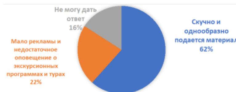
Рисунок 2. Возможные причины низкой заинтересованности молодежи в военно-патриотическом туризме

Далее следовал блок вопросов, которые затрагивают проблемы развития военно-исторического туризма и варианты их решений. Как выяснилось, основная проблема низкой заинтересованности детей и молодежи в данном виде туризма заключается в скучной и однообразной подаче информации по военно-исторической тематике (61,6%); 22,5% отметили, что организаторы недостаточно информируют о предстоящих экскурсионных программах, касающихся «Дня Победы 9 мая»; 15,9% респондентов не смогли дать точного ответа на этот вопрос: