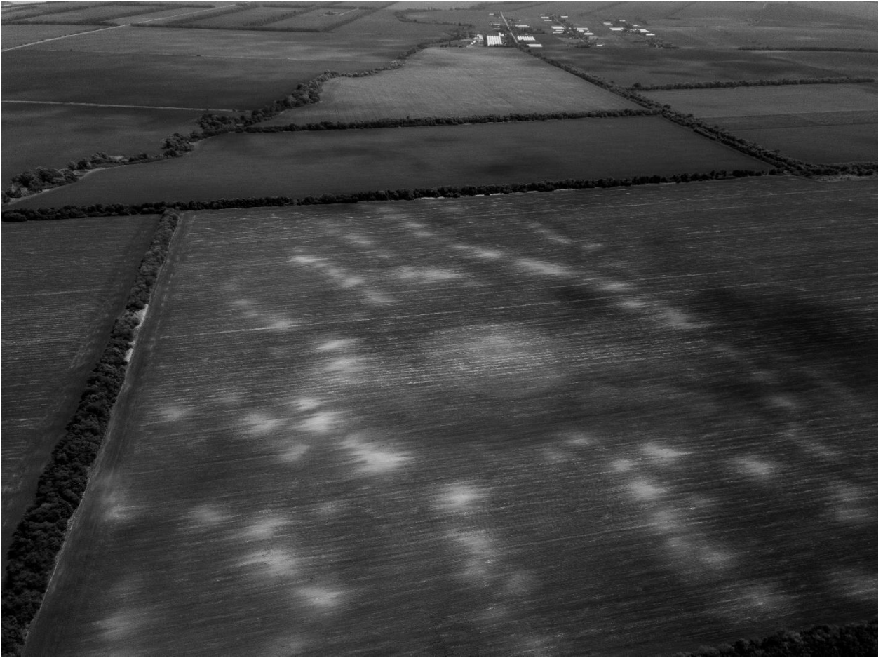
Рис. 1. Общий вид местности, занимаемой Курганной группой, вид с северо-запада, с высоты 430 м, на заднем фоне – поселок Красное Знамя Курганинского района