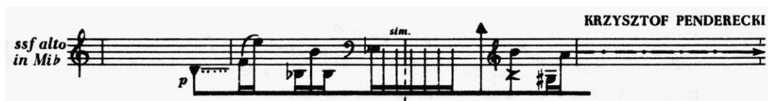
Пример 3. К. Пендерецкий. «Каприччио для скрипки с оркестром», партия саксофонов

Саксофон также включен в необычную композицию К. Пендерецкого «Каприччио для скрипки с оркестром», которая была написана в 1967 году. В партию саксофона входит импровизация. В ее начале композитор задает мелодические мотивы с точной звуковысотностью и ритмом, а затем делает пометку на импровизацию от звука в ритме шестнадцатых в низком регистре (Пример 3). После этого происходит смена регистра на средний и начинается свободная импровизация на основе ранее предложенных мотивов.