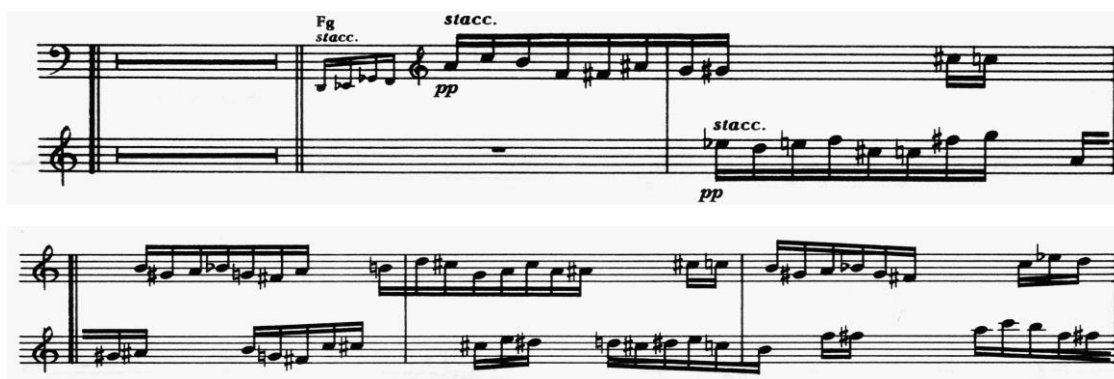
Пример 2. К. Пендерецкий. «Страсти по Луке», 2 часть, партии саксофонов

Во второй части страстей между первым и вторым саксофонами проводится диалог уже на основе мотивов шестнадцатых, не равных по длительности (Пример 2). Так, двузвучному мотиву первого саксофона отвечает трехзвучный мотив у второго саксофона и так далее. Перед музыкантами встает вопрос об ансамблевом взаимодействии. Точность совпадения игры шестнадцатых будет обеспечиваться соблюдением ритмической точности. Завершается данный эпизод указанием на технику алеаторики, позволяющую исполнителям продолжать играть мотивы шестнадцатых на свое усмотрение. В отличие от приведенного выше фрагмента, на этот раз композитор указывает тихую динамику pianissimo , что также создает новый сонорный эффект, напоминающий шорох.