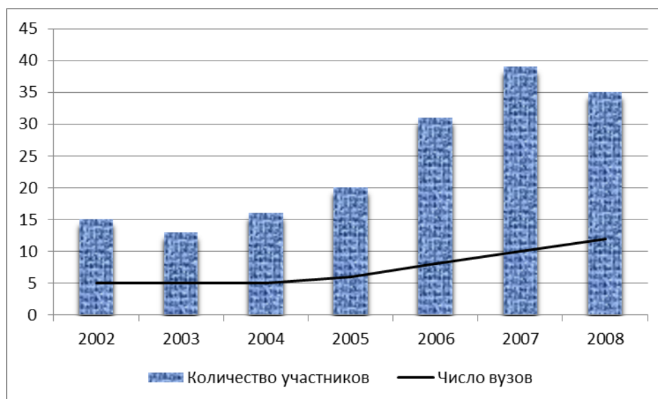
Рис. 2. Динамика количества участников и числа вузов, участвовавших во Всероссийских олимпиадах по менеджменту туризма и путешествий в 2002–2008 гг.

Географическое распределение участников регионального конкурса и третьего тура Всероссийской олимпиады в основном совпадало. В отдельные годы представители вузов Западной и Восточной Сибири, принявшие участие в конкурсе, не приезжали на олимпиаду из-за финансовых трудностей. В связи с этим, вероятно, целесообразно в будущем, наряду с очной формой проведения олимпиады, предусматривать ее дистанционный вариант, но не заменяющий, а дополняющий традиционную форму участия.