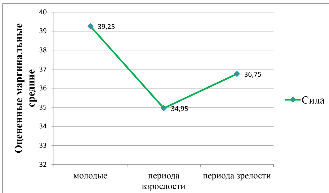
Рис.3. Влияние возраста женщин на силу (в баллах).

Различия (по Однофакторному дисперсионному анализу) между группой молодых женщин и периода зрелости являются статистически значимыми и по фактору силы (см.рисунок 3).