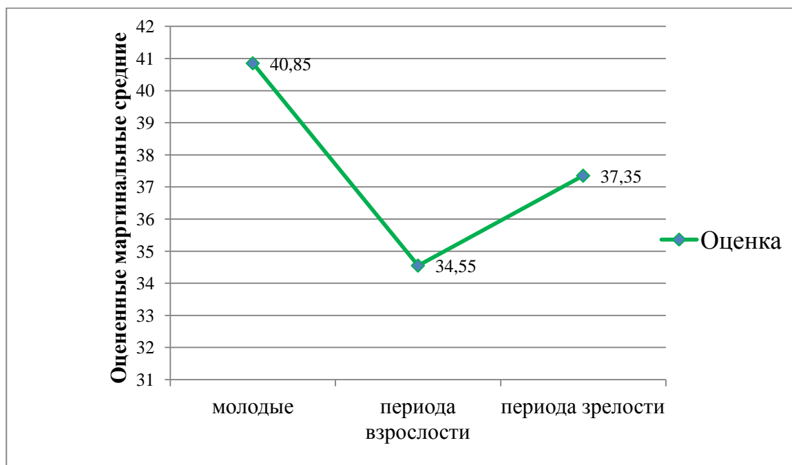
Рис.2. Влияние возраста женщин на оценку (в баллах).

Возраст является наиболее благоприятным фактором в самооценке женщин ( p < 0,001^{**} ). В целом, оценка наиболее выше проявляется у молодых женщин, чем у женщин периода зрелости, что свидетельствует о наиболее высокой самооценке, самоуважения и уверенности в себе женщин молодого возраста. Женщины периода зрелости и зрелости по значениям оценки статистически значимо не различаются.