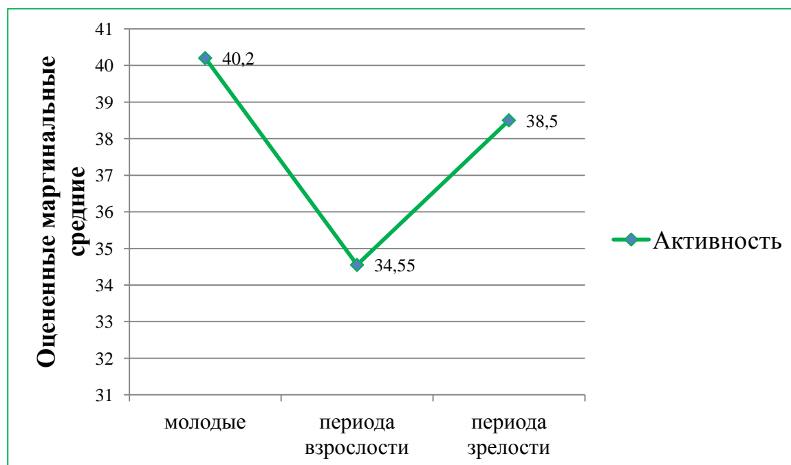
Рис.4. Влияние возраста женщин на активность (в баллах.)

Различия между группой молодых женщин и периода взрослости являются статистически значимыми и по фактору активность (см.рисунок 4).