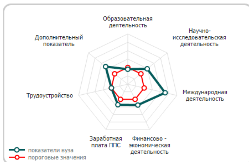
Рис.1. Показатели мониторинга эффективности деятельности ФГБОУ ВО «ВГУВТ» за 2015 год

Лепестковая диаграмма по показателям мониторинга эффективности деятельности вуза за 2015 год представлена на рис.1 [1].